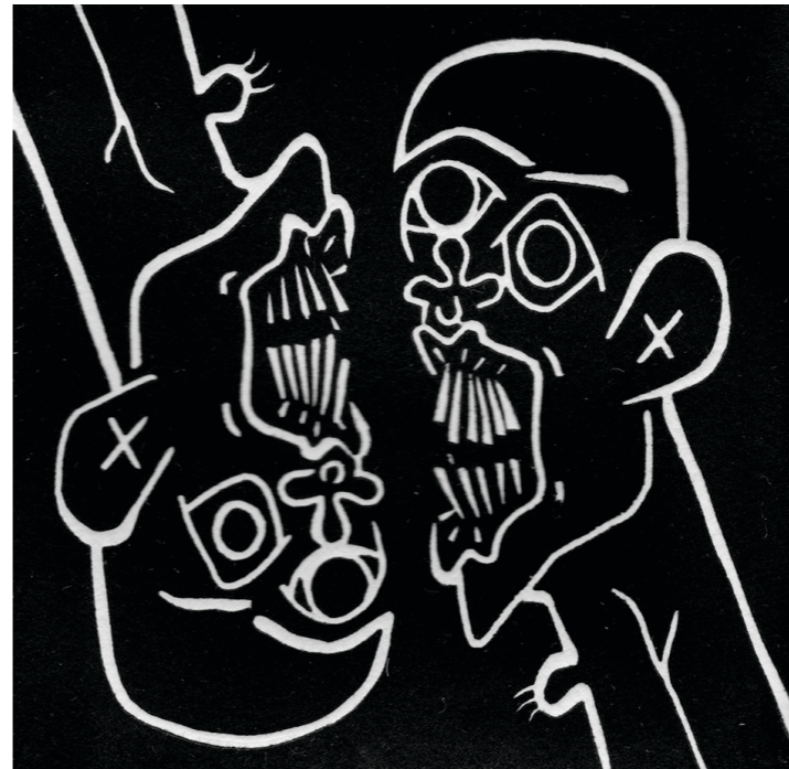
↳ Manie Linolschnitt auf Kupferdruckkarton 10*10cm Auflage von 10Stk 2023