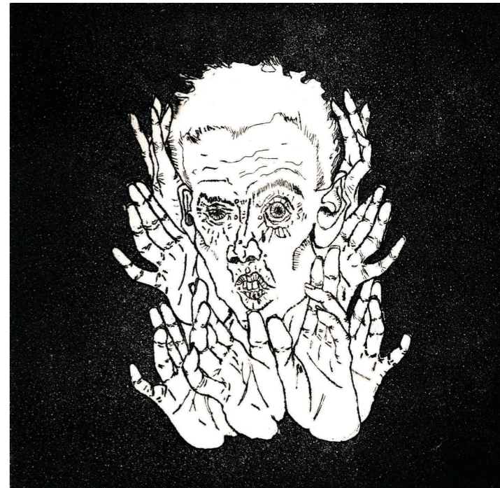
↳ Verrückt Ätznradierung & Aquatinta auf Kupferdruckkarton 15*15cm Auflage von 10Stk 2023