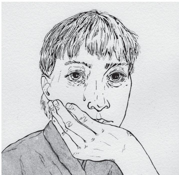
→ Solitude Ätznradierung & Aquatinta auf Kupferdruckkarton 15*15cm Auflage von 10Stk 2023