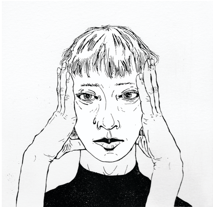
↳ Despair Ätznradierung & Aquatinta auf Kupferdruckkarton 15*15cm Auflage von 10Stk 2023