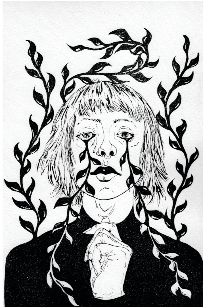
↳ Ohne Titel Ätznradierung & Aquatinta auf Kupferdruckkarton 20*30cm Auflage von 10Stk 2023