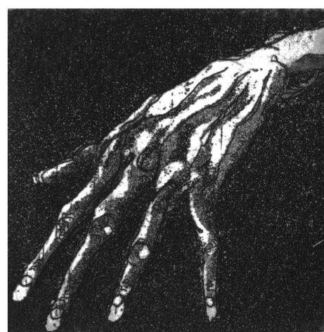
↳ Handstudy 1 Ätznradierung & Aquatinta auf Kupferdruckkarton 5*5cm Auflage von 15Stk 2020